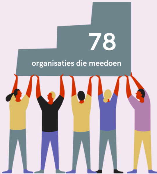
Vorming en start van de netwerkgroepen