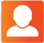
Verpleegkundig Specialist (VS)

Taakherschikking is het structureel herverdelen van taken inclusief verantwoordelijkheden tussen verschillende beroepen. Bepaalde medische taken worden structureel overgedragen aan de VS/PA.